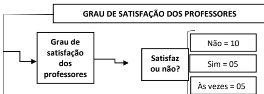
Figura 1 - Representação da categoria: grau de satisfação dos professores da pesquisa

Para Nóvoa (1992), a formação continuada de professores necessita ser considerada como o momento-chave da capacitação profissional, articulando-se com o desenvolvimento da sociedade.