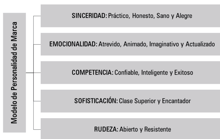
Figura 1. Dimensiones y facetas del modelo de personalidad de marca de Aaker (1997).

El estudio de Aaker (1997), ha contribuido en dos aspectos esenciales a la investigación relacionada a personalidad de marca. En primer lugar, ha señalado que este concepto corresponde a “un set de características humanas asociadas a una marca”, el cual es utilizado como referencia en la actualidad (Kumar y Nayak, 2014; Ahmed y Tahir, 2015; Escobar-Farfán, Mateluna y Araya-Castillo, 2017; Rauschnabel, Krey, Babin y Ivens, 2016; Lee y Cho, 2017). En segundo lugar, ha desarrollado una escala generalizable, validada y confiable para medir la personalidad de marca a través de cinco dimensiones de personalidad, compuesta por 42 rasgos ante las marcas comercializadas en Estados Unidos (Figura 1), la cual ha sido replicada, complementada o rechazada (Okazaki, 2006; Ivens y Valta, 2012; Escobar-Farfán y Mateluna, 2016; Liu, Huang, Hallak y Liang, 2016).