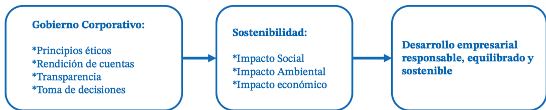
Figura 1. Interrelación entre GC y SC.

La relación entre SC y el GC ha ganado importancia en la literatura académica y en la práctica empresarial. Pues, un sólido GC promueve decisiones sostenibles integrando la sostenibilidad en el desarrollo empresarial, garantizando responsabilidad, transparencia y rendición de cuentas (Aras & Crowther, 2008). Ambos conceptos contribuyen a un desarrollo empresarial responsable, equilibrado y sostenible (Figura 1).