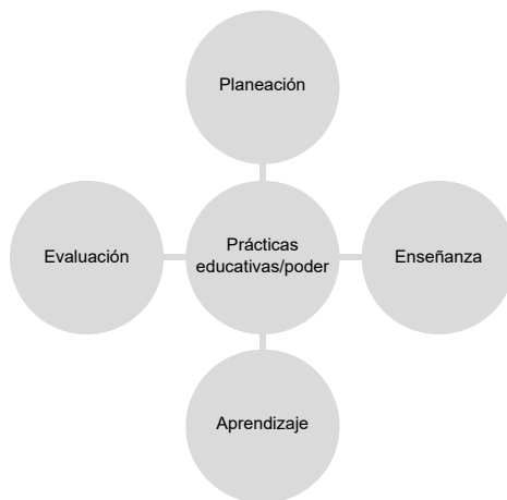
Figura 2. Aspectos de la práctica educativa