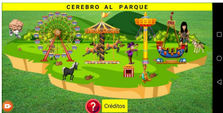
Figura 5. App Cerebro al Parque