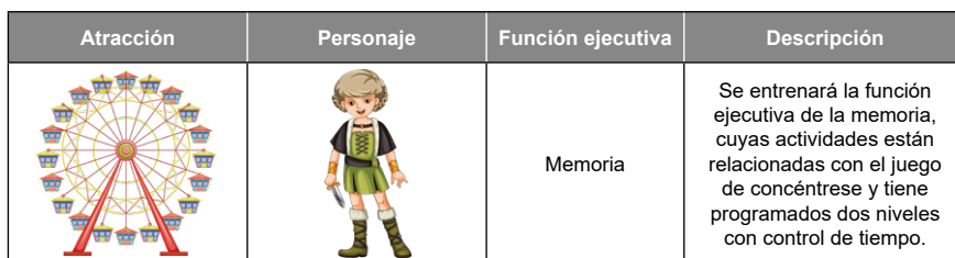
Tabla 5. Escenarios aula virtual Cerebro al Parque

La siguiente tabla representa el contenido de la app y las actividades que los niños pueden desarrollar y que les permite mejorar las funciones ejecutivas.