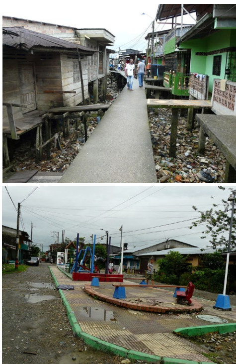
Figura 1. Algunas condiciones físicas de los barrios en Quibdó