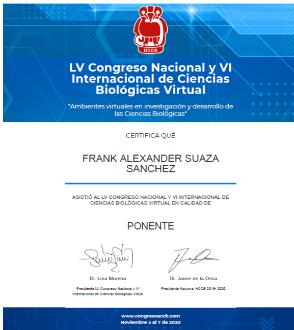
Figura 3. Presentación como ponente del VI Internacional de Ciencias Biológicas.

Esta experiencia se presentó como ponencia en el congreso internacional de ciencias biológicas del 2019 (figura 3) y fueron los estudiantes los participantes y primeros autores del trabajo.