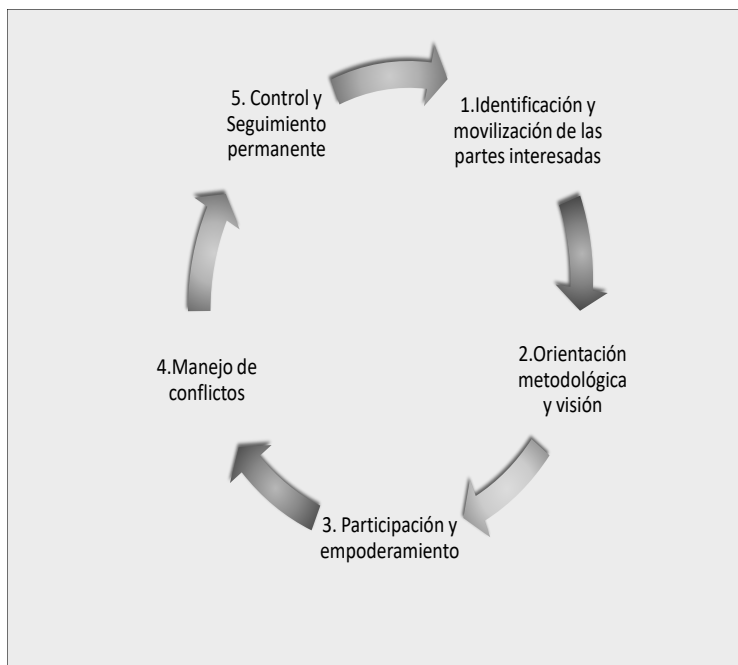
Figura 3. Proceso metodológico de las AA

recuperación y manejo integrado del recurso hídrico en cuencas del Valle del Cauca”, escalando y aplicando los desarrollos del proyecto anterior.