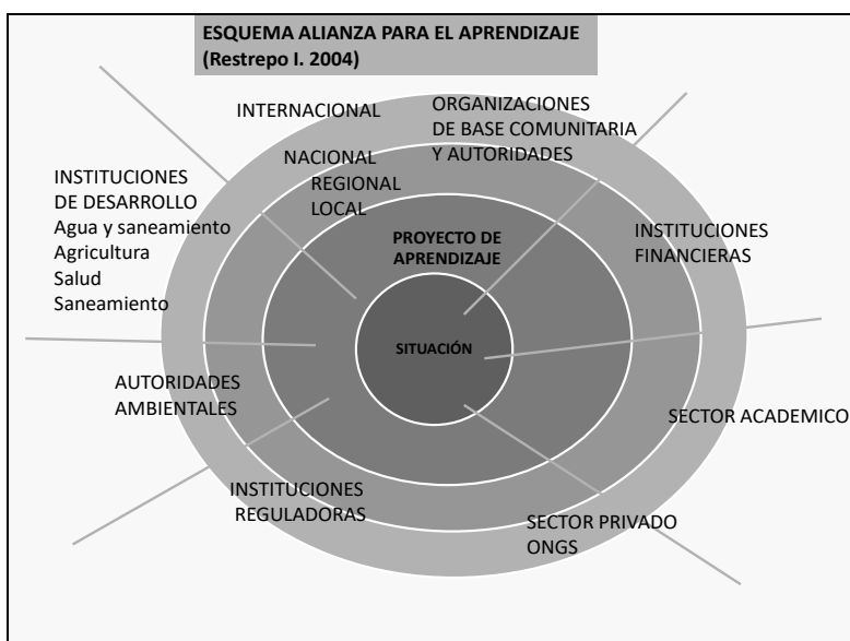
Figura 2. Esquema para la Alianza Aprendizaje

La experiencia de las Alianzas para el Aprendizaje (AA) en la Gestión Integrada de Recursos Hídricos (GIRH). Desde el punto de vista conceptual para los proyectos, las AA se han definido como “un grupo de personas que comparten una problemática y su deseo por solucionarla hace que se formen objetivos comunes y espacios para el intercambio entre actores” (Restrepo, 2005, p. 9). La estrategia de las AA se basan en la metodología de trabajo desarrollada por el International Research Centre de Holanda (IRC) (Smit, 2007, p. 23), en conjunto con el Instituto Cinara de la Universidad del Valle en la década del 90, buscando involucrar la participación de los diferentes actores de la región en los procesos investigativos para reducir la brecha entre el desarrollo del conocimiento y la apropiación del mismo por parte de los encargados del desarrollo, como mecanismo para garantizar la aplicación del conocimiento que se genera, de tal forma que las instituciones encargadas del desarrollo comparten sus experiencias, plantean las necesidades identificadas en el entorno y pueden incorporar en sus intervenciones el conocimiento generado a partir de este trabajo conjunto (Figura 2).