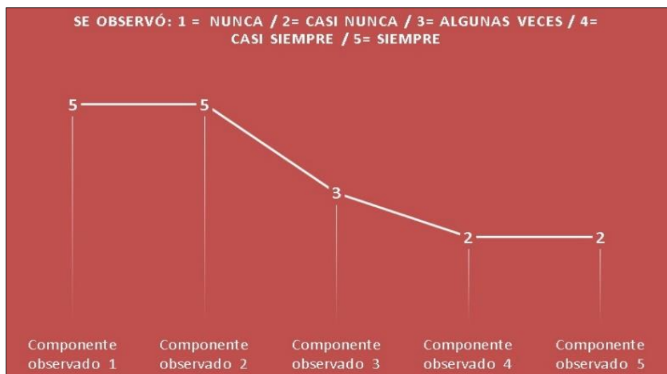
Figura 2. Fragmento gráfico 1 – Observación no participante

Consecuentemente, se percibe un reconocimiento de cada una de las imágenes presentadas, y es así como los niños lograron escribir, unir e identificar el nombre correspondiente para cada una. También se detecta que los estudiantes presentan un amplio vocabulario al identificar las palabras que se asociaban con cada imagen, de allí la importancia de la fonetización cuando se realiza de lo general a lo particular (Jaramillo y Quintero, 2020). Con base en lo anterior, se puede expresar que el proceso de lectoescritura en los estudiantes de primer grado no se da de manera estándar, ni tampoco de inmediato, sino que ante todo es un proceso gradual; es decir, se va dando por distintas etapas que depende en gran medida del estímulo que reciban del medio en el que se encuentren, a través de lo que observan en el contexto, como las lecturas e interpretaciones que realicen del mismo y del trabajo que se efectúe en la escuela serán, entonces, las medicaciones que les permitirán ir alcanzando estas etapas a un ritmo diferente. En este orden de ideas, se mostrarán los datos alcanzados en la ejecución de la observación participante.