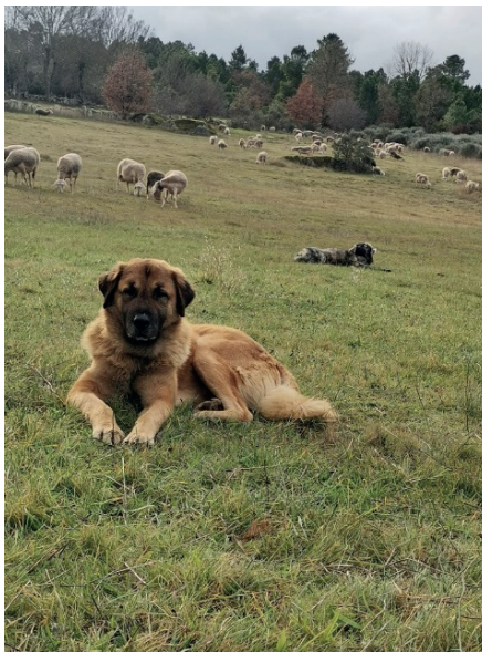
Figura 3: O cão pastor a guardar o rebanho.

possível" (R10). Esta temática é interessante para abordagens sobre o predatismo e as relações ecológicas interespecíficas. No caso da ovelha em Portugal, os predadores da localidade são as raposas, lobos e águias, que podem ter suas presenças ameaçadas por cães domesticados ( Figura 3 ) que, recebendo alimento e cuidados suficientes do seu dono, provocam o afastamento desses animais predadores, numa relação ecológica interespecífica harmônica.