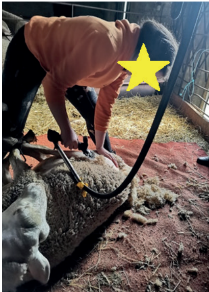
Figura 2: A tosquia.

tempo do verão se elas tiverem com aquele monte de lã vai ser pior pra elas [...]” (R3). Com este conhecimento é possível dialogar acerca da morfologia animal , motivando os estudantes a compreenderem que uma das principais características dos mamíferos é o corpo coberto por pelos ( Figura 2 ), uma adaptação que contribui para isolamento térmico e proteção desses animais.