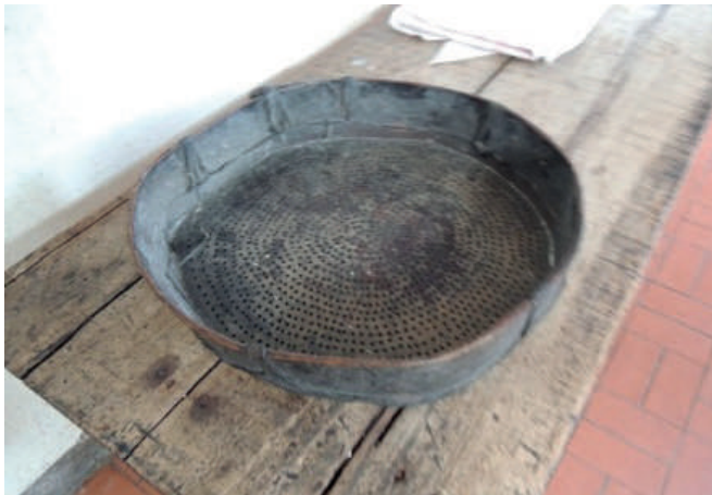
Figura 4. Utensilios realizados con pieles de animales y vegetación de la zona.

En la figura 4 se destaca la fabricación de utensilios de cocina y elementos de descanso, cedazo y silla con plantas y piles de animales de la zona.