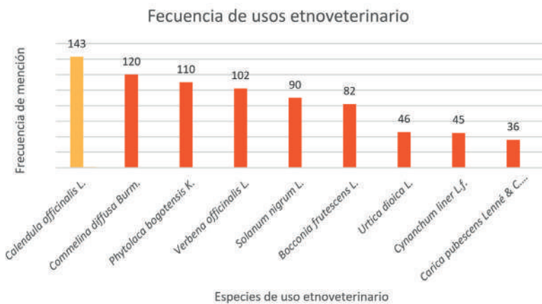
Figura 2. Usos de plantas con fines etnoveterinarios en los sistemas agrícolas familiares

En la Figura 2 se indican las especies de mayor frecuencia de uso veterinario dentro de las que se destacan Calendula officinalis y Commelina diffusa que son empleadas como cicatrizante para controlar la escabiosis y fractura de huesos.