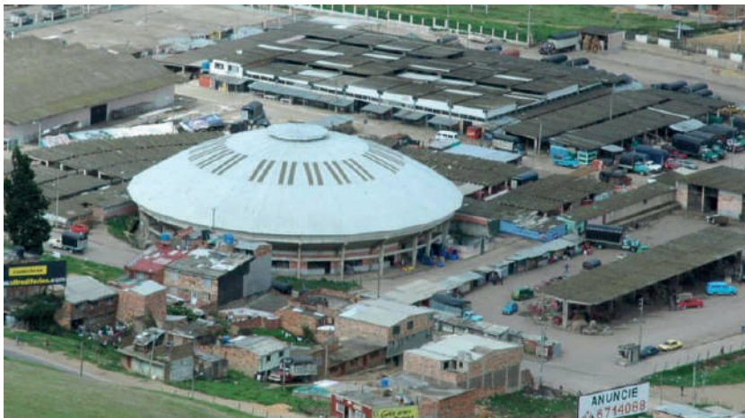
Figura 4. Arquitectura plaza mercado Sur-Tunja

Nota. Históricamente la Plaza del Sur tuvo su origen cerca al centro de la ciudad, pero en la década de los 80, debido a la necesidad de valorar el patrimonio cultural de la capital del departamento, y la importancia de restaurar algunos espacios cercanos a la Plaza Real, se trasladó a su ubicación actual. Se comercializan productos como ropa usada, zapatos, aluminios, canastos, verduras y granos, entre otros, pero son los productos agrícolas, que proceden de diferentes regiones del país, los que representan su mayor comercio.