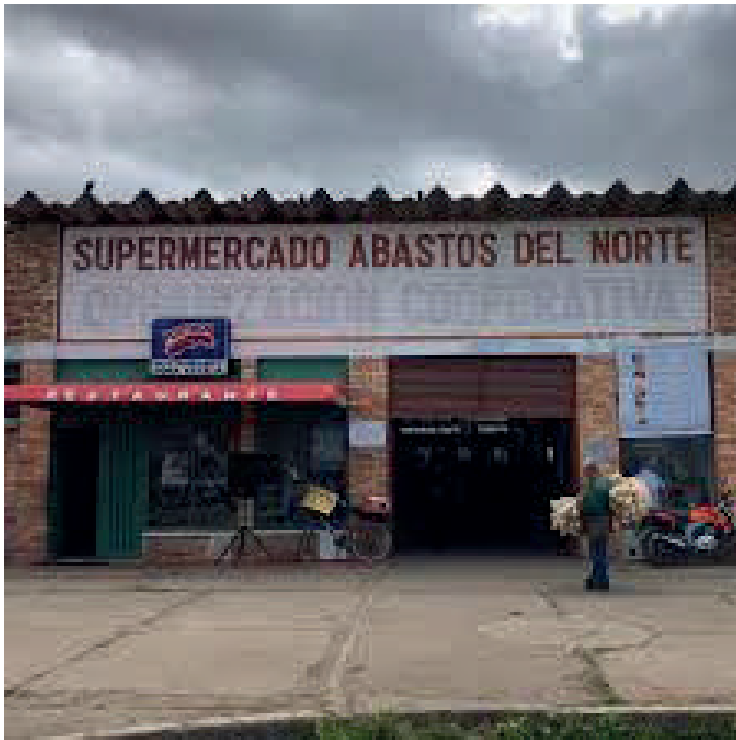
Figura 2. Arquitectura plaza de mercado Norte-Tunja.

Nota. Este espacio fue creado para el bienestar de la comunidad de los barrios en septiembre de 1986, se dio al servicio por el alcalde José María Aponte Quintero bajo la administración y propiedad de EMPOTUNJA LTDA., donde familias y cultivadores del campo llegaban con sus cosechas para ofertarlas al mayoreo a comerciantes y a la ciudadanía, las personas que los comercializan son principalmente mujeres.