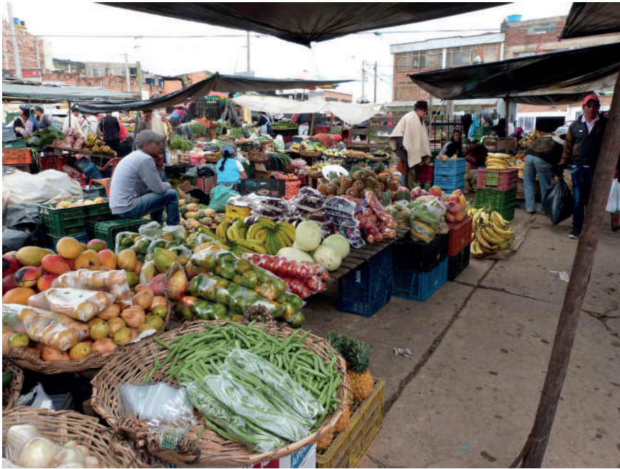
Figura 5. Fotografía de la plaza de mercado Sur-Tunja

Nota: En ella se identifica los lugares de comercialización al interior de la plaza.