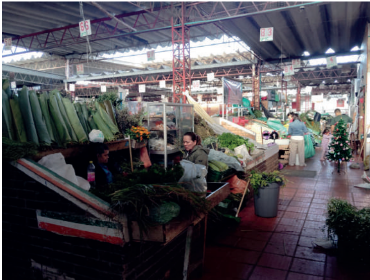
Figura 3. Fotografía de la plaza de mercado Norte-Tunja.

NOTA: Se visualiza la organización de los puntos de comercialización al interior del lugar.