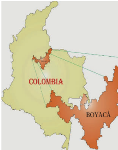
Figura 1. Mapa de ubicación geoespacial de las plazas de mercado de Tunja-Boyacá

La población se encuentra ubicada en la ciudad o en sus cercanías, la siguiente figura representa la ubicación geoespacial de los lugares de estudio.