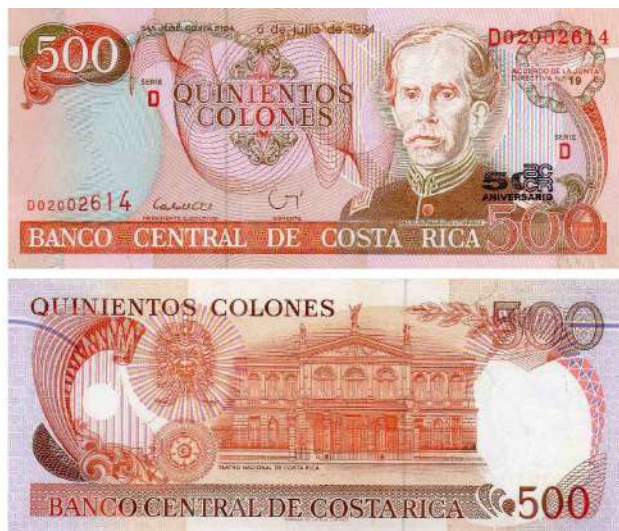
Imagen 2. Diseño del billete de 500 colones, emisión de 1979-1985. (Se reproduce una edición especial conmemorativa, emitida con el mismo diseño en 1994)