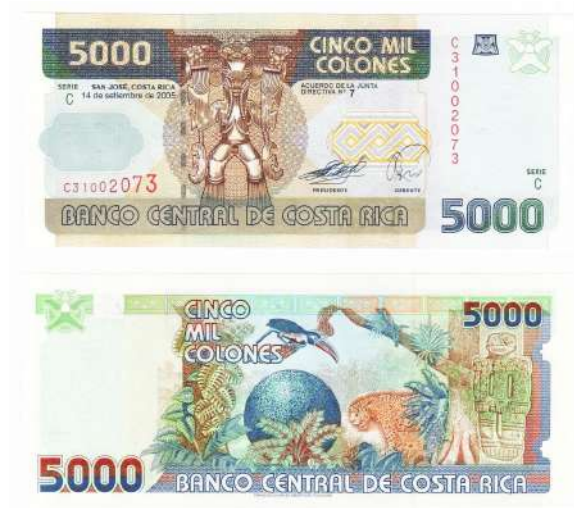
Imagen 12. Billete de 5 000 colones, Serie C, 1991-2008

Fuente: Banco Central de Costa Rica, billetes retirados de circulación.