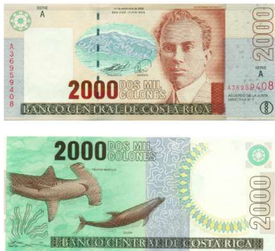
Imagen 13. Anverso y reverso del billete de 2 000 colones. Serie A, 1997-2008

Fuente: Banco Central de Costa Rica, billetes retirados de circulación.