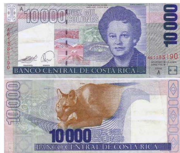
Imagen 14. Anverso y reverso del billete de 10 000 colones. Serie A, 1997-2008

Fuente: Banco Central de Costa Rica, billetes retirados de circulación.