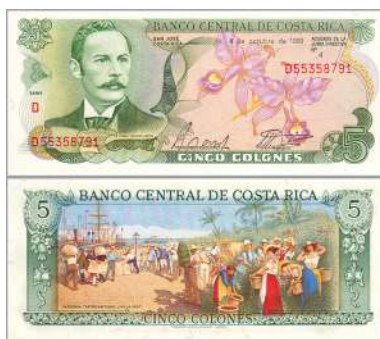
Imagen 4. Diseño del billete de cinco colones, 1968-1992