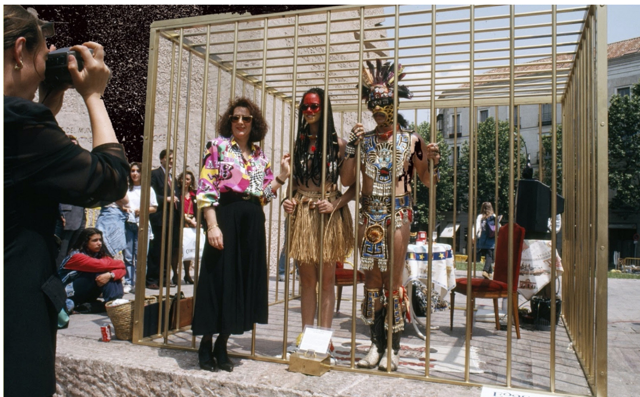
Imagen 3. Guillermo Gómez Peña y Coco Fusco en The Couple in a Cage