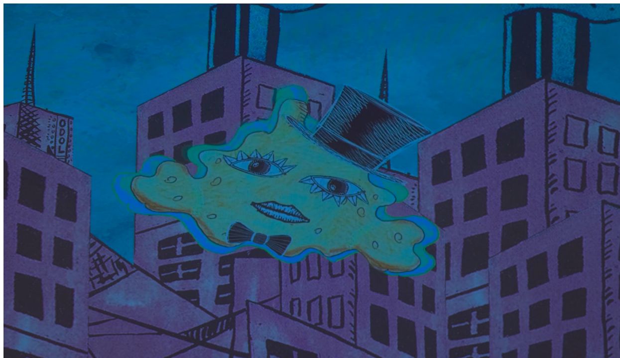
Imagen 4. Fotograma de la esponja mutante

La esponja recorre la ciudad de Estridentópolis, una Xalapa imaginada por el movimiento estridentista de la segunda década del siglo XX (Imagen 4). El estridentismo, que surgió de las cenizas de la Revolución Mexicana, propuso como base de sus reivindicaciones la iconoclasia, la crítica, el humor y la disidencia utilizando la poesía, la imagen, la danza y la intervención. La nueva mutación de esta “notable” y “folclórica” criatura urbana hereda al mundo de los estudios de la performance sistemas acuíferos de hoyos, canales y cámaras en las cuales las personas pedagogas, artistas, investigadoras y activistas trabajan libremente desde sus posicionamientos políticos y estética radicales, sin alinearse a ideologías hegemónicas contemporáneas.