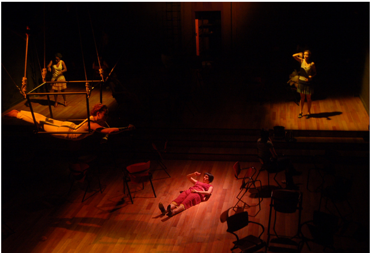
Imagen 5. Vacío en el Teatro Universitario durante el año 2011