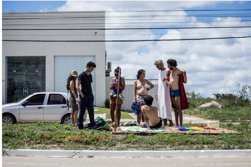
Figura 2. Activación de la Praia do Suíço. Registro de performance /intervención urbana