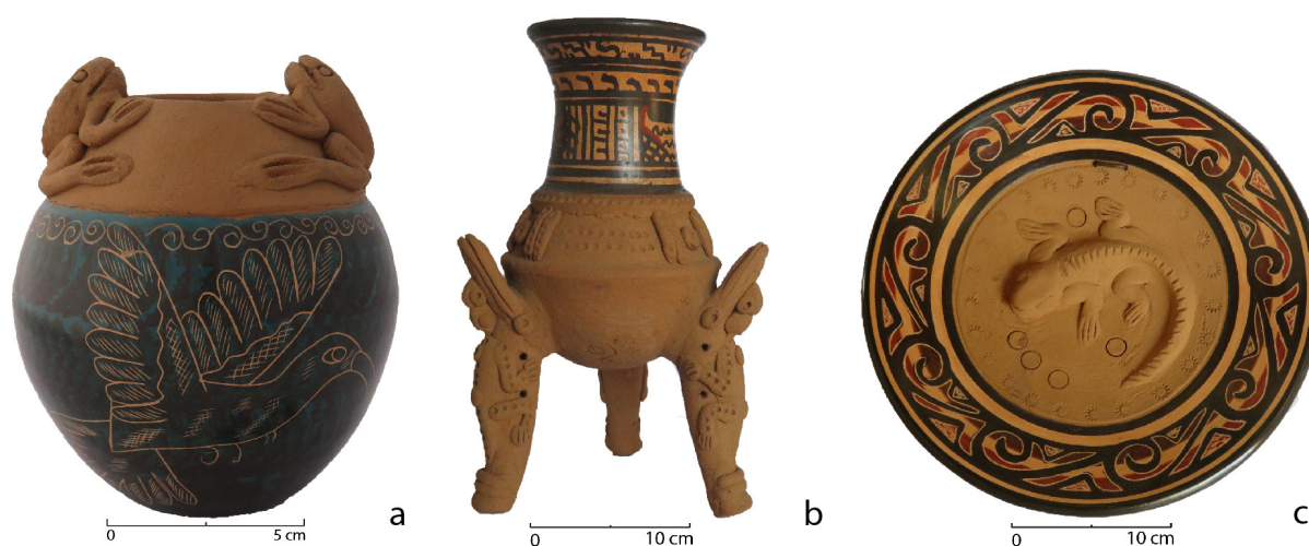
Figura 4. Representaciones con temas contemporáneos hechas por Nury Marchena Grijalba (a) y Elpidio Chavarria Chavarria (b y c)