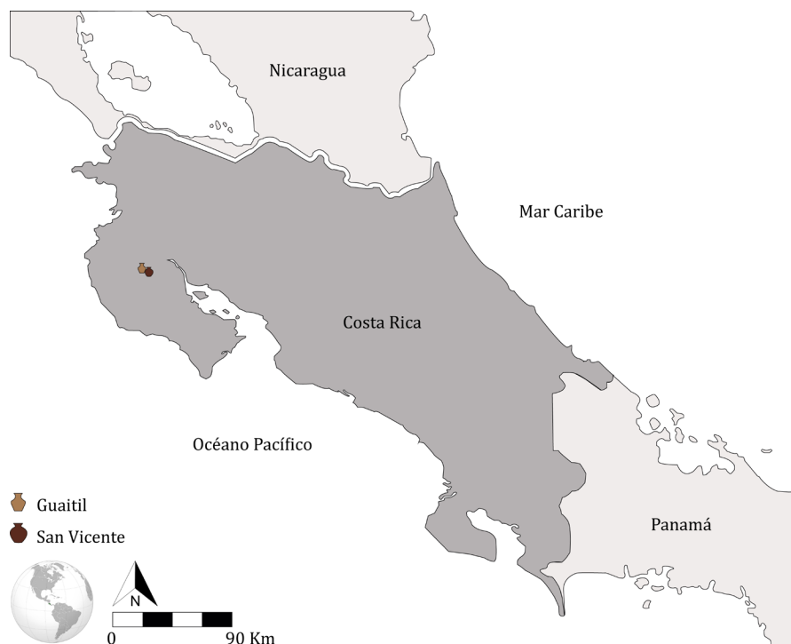
Figura 1. Localización de las dos comunidades en estudio en relación con Costa Rica

El presente artículo surge como parte de los resultados del trabajo de tesis titulado Diseño cerámico en el arte popular de Guaitil y San Vicente, Guanacaste, Costa Rica . En específico, este documento tiene como objetivo analizar el concepto de arte popular a partir de la integración de las dos disciplinas que lo conforman: la Filosofía Política y la Estética, desde el contexto social de producción de la cerámica que realizan las comunidades alfareras de Guaitil y San Vicente –ubicadas en la provincia de Guanacaste, Costa Rica– (Figura 1). Lo anterior se realiza mediante el estudio de tres elementos que la constituyen: la formación de la persona ceramista, el vínculo con la tecnología y el papel del mercado en su producción.