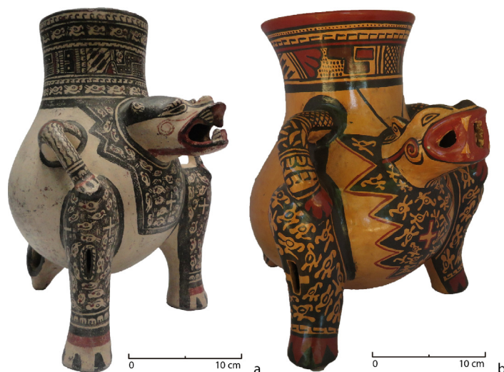
Figura 2. Vasija efigie precolombina (a) y su réplica contemporánea (b), hecha por el ceramista Luis Alberto Gutiérrez Gutiérrez