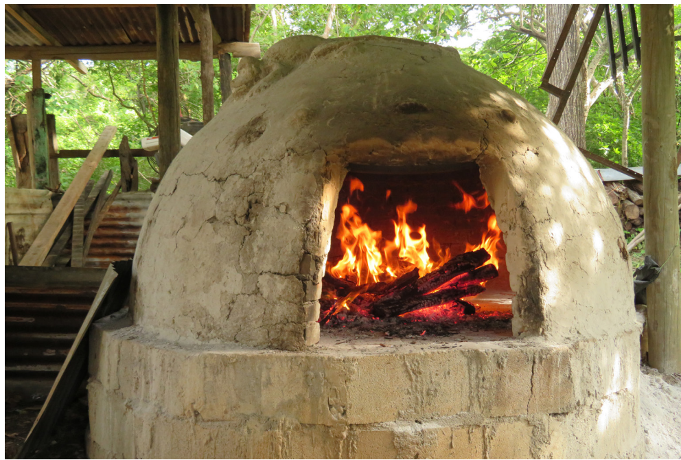
Figura 3. Horno tradicional para la quema de obras cerámicas