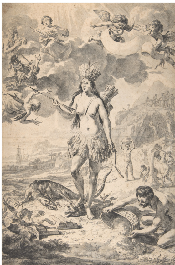
Figura 2. Dibujo hecho por el artista neerlandés Nicolaes Berchem, donde representa el continente americano mediante una india semidesnuda con falda de plumas carcaj, arco, flechas y corona de plumas. Fechado a finales del siglo XVII. 44.8 x 30 cm

Fuente: Berchem, Nicolaes (1622-1683) . Museo Metropolitano de Nueva York. Dominio Público.