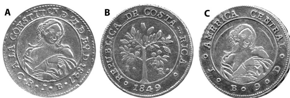
Figura 4. Monedas de plata de un real (1.R.), 1847 y 1849, 20 mm, acuñadas por la Casa de la Moneda de Costa Rica con el busto de una joven india. A. 1847. Orla del reverso: A la Constitución del 21 de Enero de 1847. C.R. (Costa Rica), J.B. (Juan Barth) . B. 1849. Orla del anverso: República de Costa Rica . En el centro un arbusto de café con frutos. C. 1849. Orla: América Central . Nótese que se mantiene la asociación entre la india y América. 9. D. (9 Dineros o 750 milésimas de plata)

Fuente: Colección numismática del autor. Fotografías del autor que conservan el brillo, color y estado de conservación de las monedas.