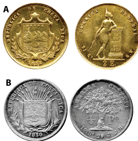
Figura 1. A. Moneda de oro de dos escudos (2 E, o Cuarta de india ), 1855, 21 Q s (Quilates), 23 mm, 6.7 g. Ensayador Guillermo Witting (G. W.). Escudo de Armas sin armas y con un marco ornamentado. B. Moneda de un cuarto de peso (1/4 P o ), 1850, 10 D s .20 G o (903 milésimas de plata), 24 mm, 6.4 g. Ensayador, Juan Barth (J. B.). Escudo de armas con trofeos de guerra. Árbol de encina o roble