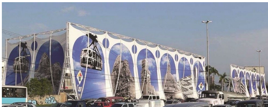
IMAGEM 3 Fachada do Casa Shopping em 2015

cenários do centro e da Zona Sul, em uma lembrança de que, a despeito da distância física e paisagística, se tratava de um estabelecimento genuinamente carioca.