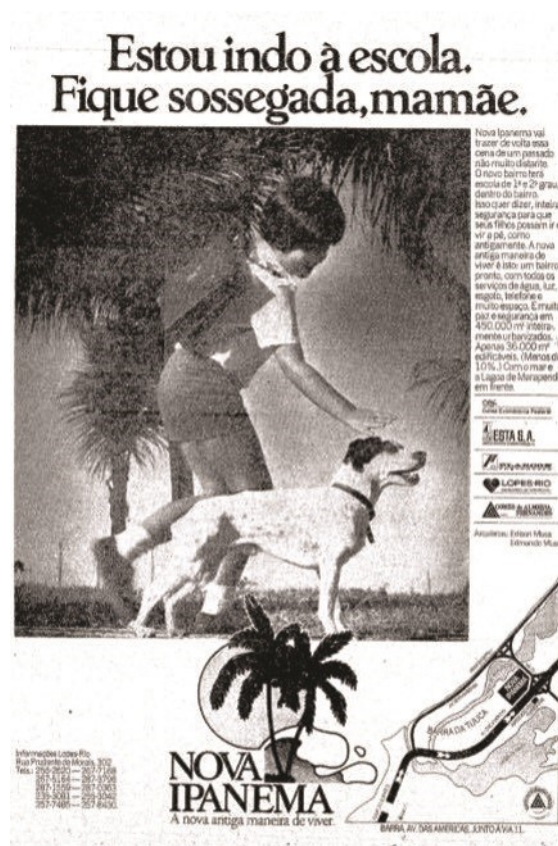
IMAGEM 2 Anúncio Nova Ipanema O Globo (ESTOU..., 12/07/1975, p. 5).

O condomínio Novo Leblon, inaugurado um ano depois, convidava o carioca a “viver onde você gostaria de passar suas férias”, em outra mostra do investimento do setor imobiliário na criação de um estilo de vida pautado na reunião de moradia, paisagem natural, lazer e serviços em um mesmo espaço. Nascia ali um verdadeiro boom de construção de condomínios fechados, que, sob a forma de “enclaves fortificados” (CALDEIRA, 2000), davam perfil privado e restritivo ao ideal modernista das unidades de vizinhança – que previa extensões residenciais abertas ao público, dotadas de fácil acesso a comércio e a serviços públicos, como escolas, e marcadas por forte heterogeneidade social.[15] Com uma ostensiva separação entre um “dentro” e um “fora”, os novos condomínios da Barra da Tijuca apostavam na contratação de sistemas de segurança privada para oferecer aos seus moradores a tranquilidade que os tradicionais bairros da cidade pareciam já não poder garantir.