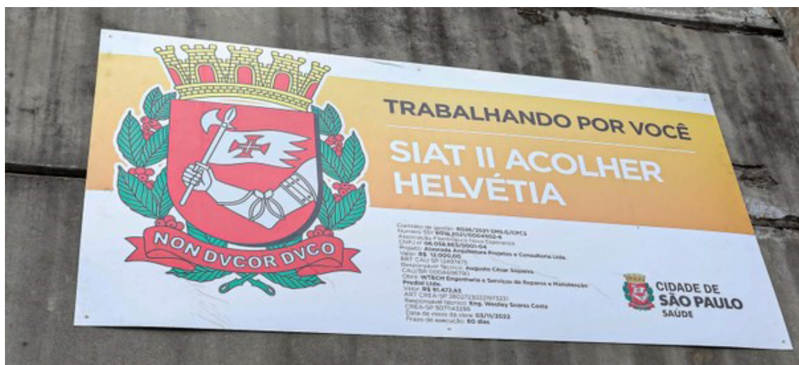
Figura 3 – Placa de identificação do SIAT II Acolher Helvétia