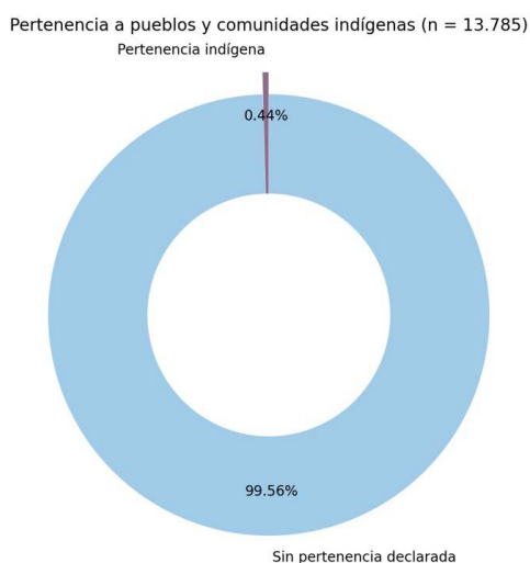
Figura 3. Pertenencia a pueblos a pueblos y/o comunidades indígenas en la Facultad de Ciencias Políticas y Sociales de la Universidad Nacional de Cuyo

Nota. Los gráficos fueron generados utilizando Python y su ecosistema de bibliotecas de código abierto.