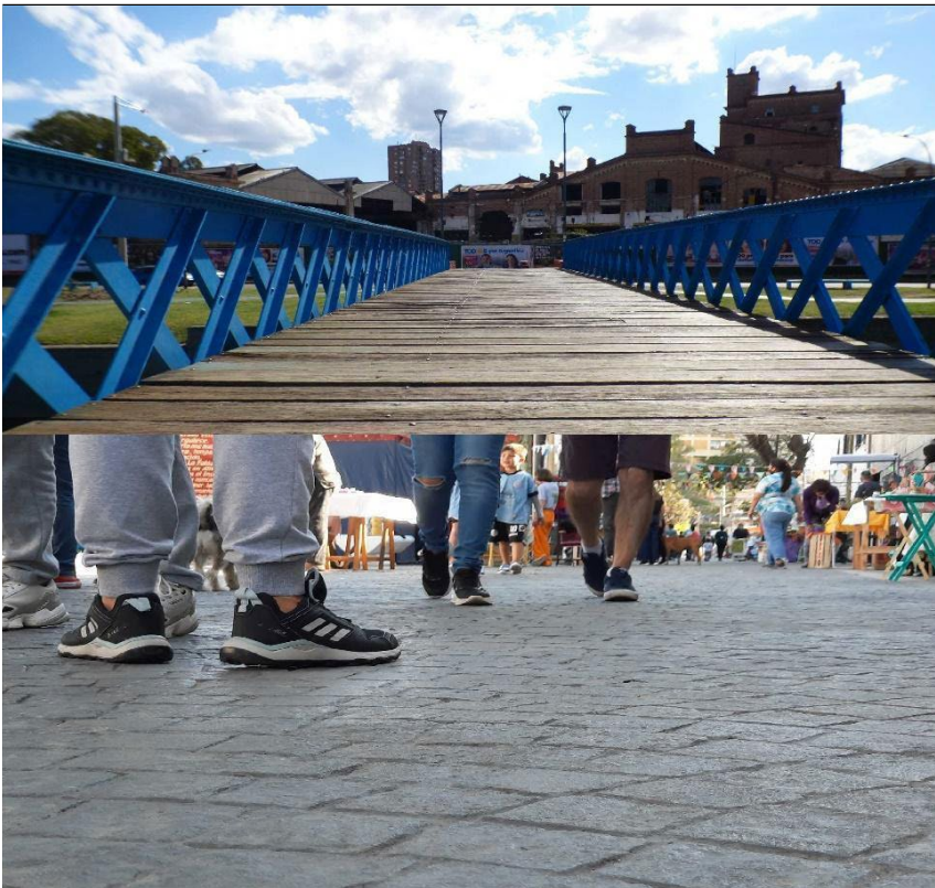
Imagen 2. Historia y patrimonio del barrio (I)