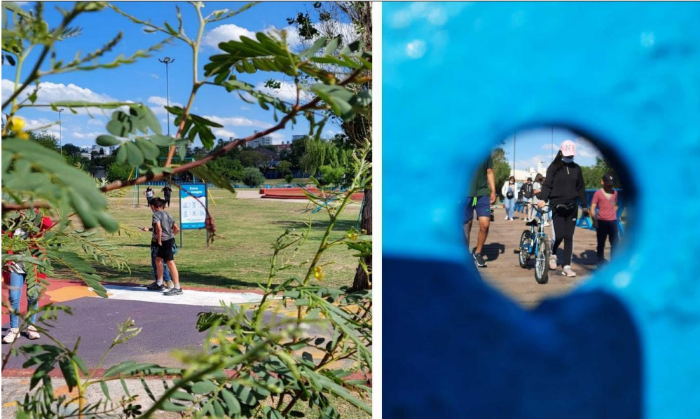
Imagen 1. Espacio de encuentro (I)