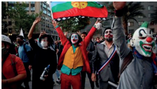
Protestas en Santiago de Chile durante el estallido social de 2019

Cuando se estrenó la película, el personaje de Joker produjo fascinación: una víctima del sistema que se rebelaba haciendo justicia por mano propia. En un giro en el que la vida imita al arte, durante los disturbios de Chile de 2019 se presentaron muchos manifestantes con la cara pintada de Joker. “Dicho filme generó un abismante grado de identificación con el grueso de la población chilena –abismante porque se trata de un filme apocalíptico–, identificación efectuada sobre todo con los sectores juveniles urbanos (hijos solos y empastillados, estudiantes sin perspectivas y trabajadores precarizados). Pero ante todo el filme proporcionó una narrativa que –a falta de contacto con alguna tradición– actuó como verosímil para leer las propias circunstancias y algún curso de acción. Si el Joker es la historia de una víctima que toma revancha, y tras de él los habitantes de una ciudad entera que entra en caos, visto el desarrollo del estallido, la lectura parece haber sido que la víctima tiene derecho a destruir todo lo que cree que la ha dañado o vehicula ese daño (y basta con que lo crea)”. 6