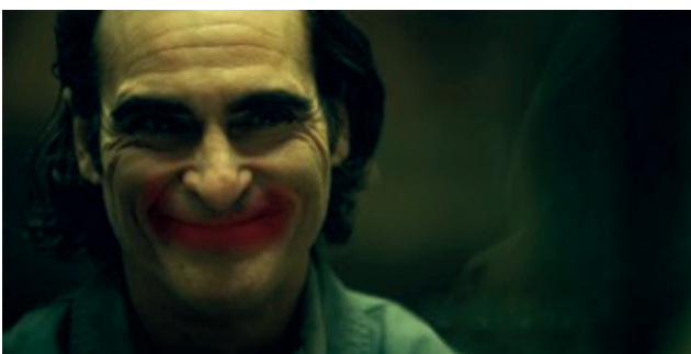
Joaquin Phoenix en Joker: folie a deux , de Todd Phillips

Keywords: Madness | Mis en abyme | Responsibility