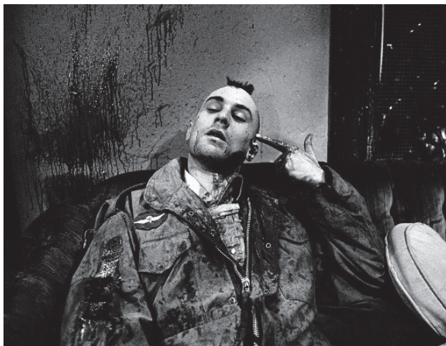
Robert de Niro en Taxi Driver , de Martin Scorsese

Travis: ambos son seres solitarios y alienados que vivieron situaciones traumáticas y se entregan a sus fantasías para escapar de sus frustraciones, mientras transitan por una ciudad hostil y decadente. Al final, producen una explosión de furia violenta en la que matar y matarse pasan a ser equivalentes.