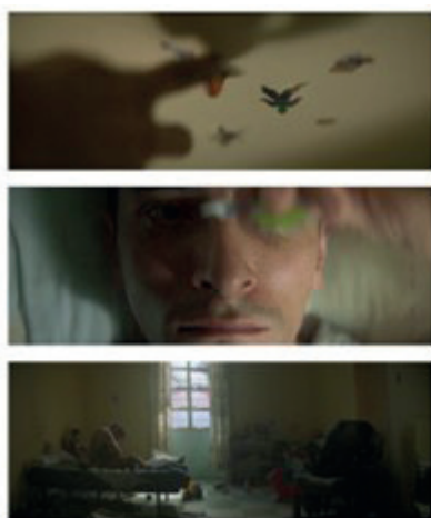
Figura 1. Juego de montaje con la espacialidad

pacio tridimensional se puede encontrar al comienzo de esta escena narrativa, cuando en un inserto ( insert shot ) se observa una mano rascando una calcomanía en la pared, para pasar a su contraplano en donde se presenta el rostro de Montoya en ángulo cenital observando la calcomanía que despegó. Al no existir un plano abierto que oriente la distribución espacial desde el inicio y debido al ángulo en cenital, es posible interpretar que la calcomanía se encontraba en el techo y que éste estaba situado demasiado cerca del rostro de Montoya, como si se encontrara encajonado o en un ataúd. Sin embargo, dos planos más adelante -después de mostrar al perro- se comprende que las calcomanías se encontraban en la pared que da a la cabeza de la cama (Figura 1).