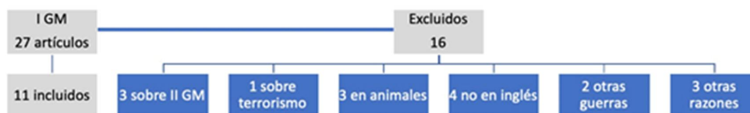
Figura 1. Artículos sobre I Guerra Mundial incluidos/excluidos del trabajo Figura 1. Artículos incluidos/excluidos en este trabajo (I Guerra Mundial)

Con respecto a la II Guerra Mundial, se usaron idénticos criterios de selección, obteniéndose un total de 13 artículos, con 9 exclusiones (1 artículo repetido, 1 sobre terrorismo, 2 estudios en animales, 1 sobre otras guerras, 3 en otros idiomas -no inglés ni español- y 1 estudio in vitro ). Figura 2.