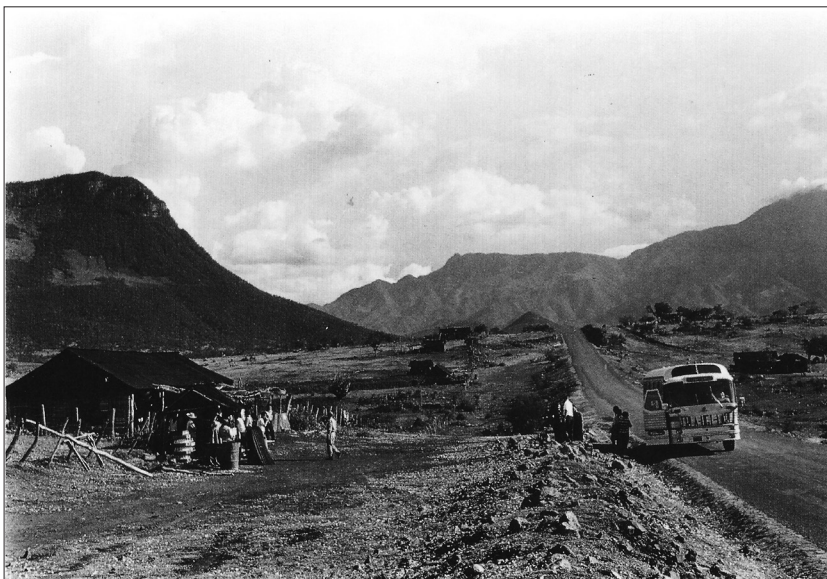
Figura 3. Parada de los excursionistas de la CRLA-UGI en el camino de Infernillo (agosto de 1966). Foto de Orlando Ribeiro y Suzanne Daveau. Fuente: Ribeiro (1994c).

Así, entre aquellas fotografías con registro omiso o con referencia menos precisa por haber sido tomadas desde el avión, tenemos noticias en el catálogo de 8 de la Ciudad de México, 3 de la pirámide de Cuicuilco, 12 de Teotihuacan, 4 de Querétaro, 17 de Guanajuato, una del camino entre Irapuato y La Piedad, 4 de cultivos agrícolas en Ayo del Chico (Ayotlán), 3 de Guadalajara, 5 de itinerarios alrededor del lago de Chapala, 21 de pueblos, volcanes y poblados limitados por Angahuan y Uruapan, 13 del itinerario alrededor de la presa de Infernillo, 16 del itinerario en torno al volcán Parícutín, una de la calle principal de Morelia, 8 de Umán (en las cuales se incluyen algunas enfocadas en el cultivo