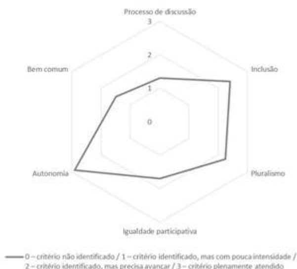
Figura 3 – Média dos critérios das seis categorias da Cidadania Deliberativa 2017

Conforme o gráfico acima, é possível afirmar que a categoria Autonomia é identificada com grande intensidade. Como discutido anteriormente, é notório que durante as reuniões do conselho, propostas de melhorias podem ser feitas por qualquer cidadão, por mais que haja predominância de sugestões que representem o interesse das entidades dos conselheiros. Conseqüentemente, o fato de a representatividade do conselho indicar grande parte das propostas vinculadas aos interesses dos seus respectivos órgãos representativos, a categoria do Bem Comum apresenta baixa identificação, visto que nem sempre é possível visualizar na sociedade a efetividade de propostas na vida dos beneficiários.