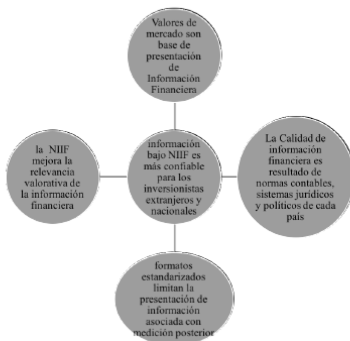
GRÁFICO 1. Elementos de interés según marco de antecedentes

Se puede entonces esperar que los procesos de adopción de NIIF en empresas industriales y comerciales de Cuenca estén influenciados en gran medida por la aplicación de modelos de revaluación, formatos de adopción emitidos por entes de control, limitaciones en descripciones sobre determinación y selección de valores razonables. Además, se espera incrementos y disminuciones patrimoniales importantes por la utilización de Resultados Acumulados por ajustes de NEC a NIIF.