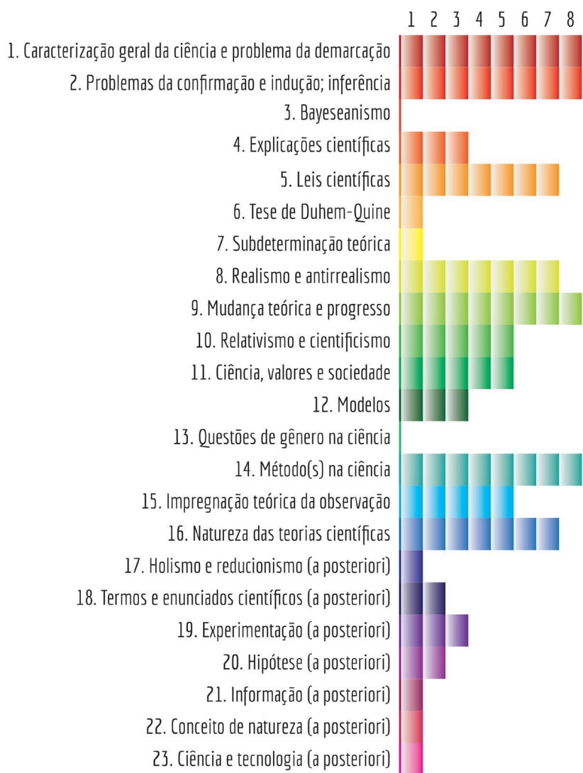
Figura 3. Quantidade de Livros Analisados em que cada Categoria está Presente autoria própria.

As categorias, apesar de aparecerem em diversos livros, não necessariamente recebem a mesma ênfase. A ênfase dada a cada categoria foi inferida pelo número relativo de ocorrências dentro de cada livro e o somatório das porcentagens de cada categoria no conjunto de livros nos dá, portanto, uma visão da ênfase geral dada a cada uma (Figura 4).