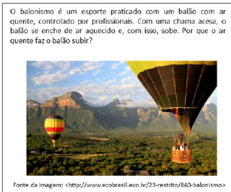
Figura 6. Atividade disponibilizada aos estudantes

As respostas dadas a esse questionamento também foram agrupadas por semelhança, conforme Tabela 4, reunindo as obtidas por meio do questionário e da aula síncrona, na qual o assunto foi retomado.