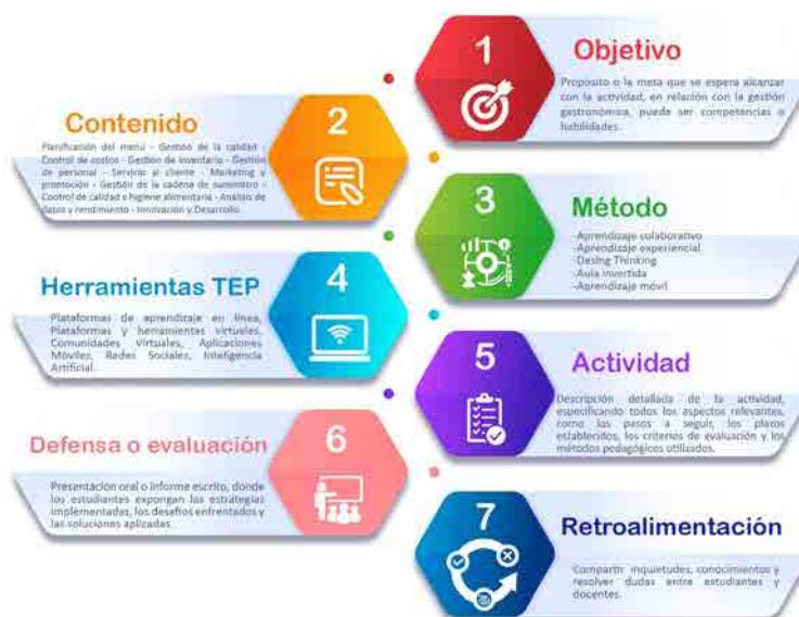
Figura 3: Descripción de fases de la estrategia pedagógica