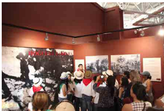
Figura 4: Recorrido de alumnos guayaquileños por el Museo Histórico “Memorias de la Revolución Liberal Radical” (julio de 2016)