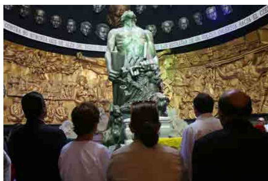
Figura 5: Visitantes observan la escultura de Eloy Alfaro realizada por el artista Ivo Uquillas, ubicada en el monumento a la Hoguera Bárbara del Centro Cívico Ciudad Alfaro, Montecristi, Ecuador