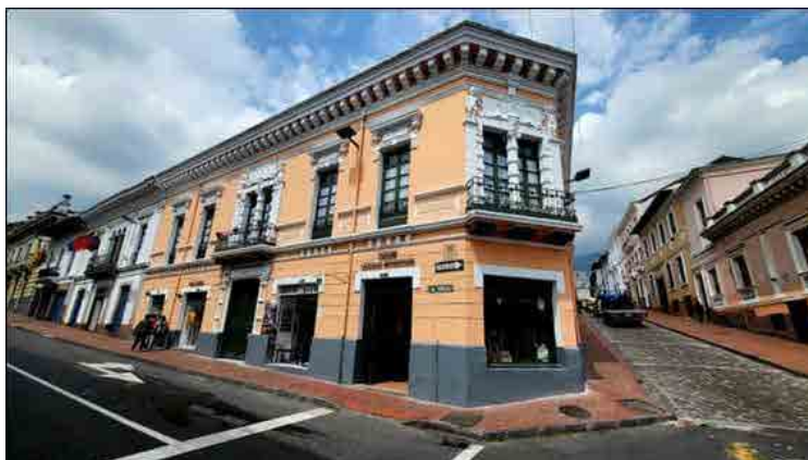
Figura 2: Edificación donde vivió la Dra. María Zúñiga en su etapa universitaria

Sus inicios universitarios no fueron nada fáciles, pues en 1924, al ser la única mujer en toda la Escuela de Medicina, enfrentó rechazo y discriminación por parte de sus compañeros, aunados a una alta exigencia académica. Sin embargo, el triunfo de su antecesora, Matilde Hidalgo, marcó un antes y un después en las mujeres que siguieron sus pasos.