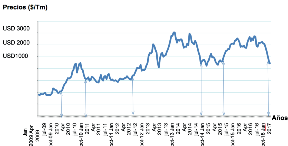
Figura 2. Precio promedio internacional CIF al contado del cacao en grano (Puertos de EE.UU.: y Europa) 2009-2017

Internacionalmente los precios del cacao en el mercado mundial están sujetos a fluctuaciones. Ghana, es el país, donde se determina el precio mínimo del cacao del mercado actual. El cacao de Ghana con certificación de Max Havelaar (la primera iniciativa de organismo de certificación de comercio justo en 1988) ha impuesto una bonificación, que se agrega al precio mínimo (CECU, 2007).