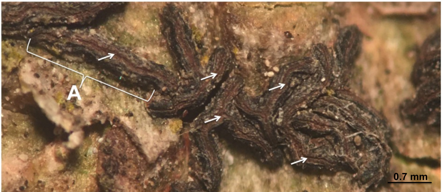
Figura 2: Lirelas (A) de Glyphis substriatula (Nyl.) Staiger, con abundante pruina parda en la abertura de los labios (flechas).