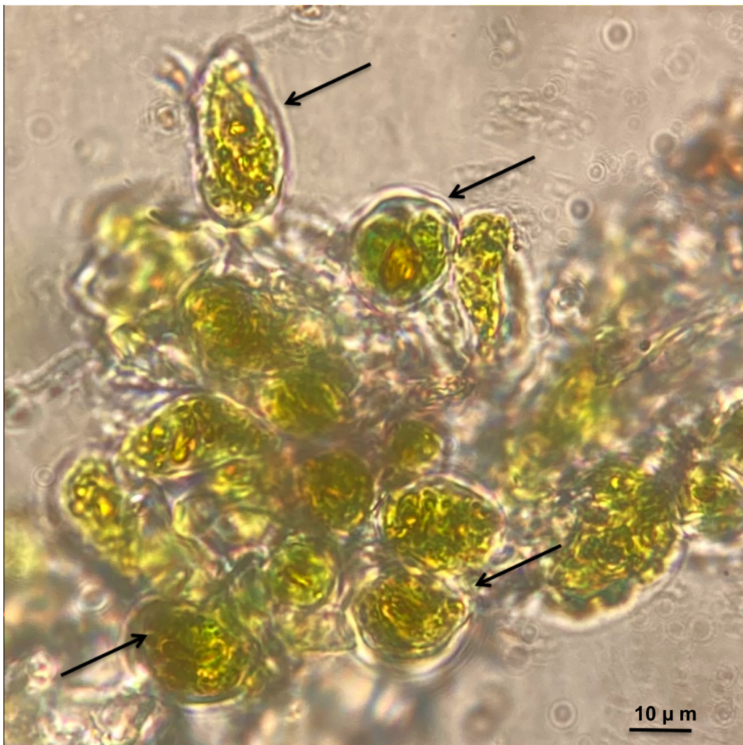
Figura 3: Algas unicelulares (flechas) del género Trentepohlia C. Martius, asociadas a hongos del género Glyphis Ach.