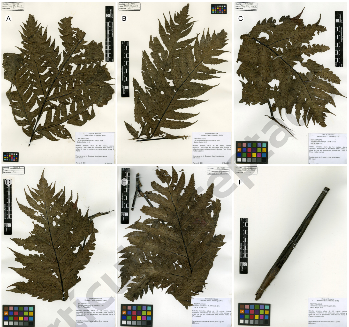
Figura 5: Tectaria subebeneae (Christ) C. Chr. Muestra herborizada. A. ápice; B. pinnas superiores; C. pinnas mediales; D. pinna basal izquierda; E. pinna basal derecha; F. raquis. J. Reyes 64 (EAP).

de la frontera agrícola y ganadera, la construcción de represas hidroeléctricas y la apertura de caminos y carreteras. Estas amenazas pudieron ser observadas durante los vuelos a la zona de estudio y debido a las visitas prolongadas, mostraron en un año un avance descontrolado de la frontera agrícola que amenaza con destruir estos ecosistemas.