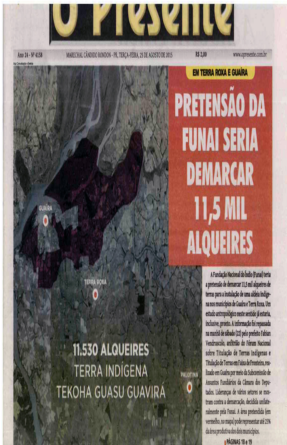
Figura 2: Capa do jornal O Presente, 25/08/2015. Vendrusculo durante Fórum Nacional Sobre Titulação de Terras Indígenas e Titulação de Terras em Faixa de Fronteira, organizado pela Subcomissão de Assuntos Fundiários da Câmara dos Deputados e realizado em Guaíra, em 22 de agosto de 2015.

Em que pese a redução da área da TI a menos de um terço dos cem mil hectares propagandeados até então, o tom dado à “nova” dimensão da TI a ser demarcada não deixava de ser propagandeada como impactante: “a área pretendida pode representar até 25% da área produtiva dos dois municípios” [Guaíra e Terra Roxa], além de que iria praticamente “ilhar” e comprimir a área urbana de Guaíra, a porção mais clara, cercada pela mais escura no mapa (imagem 2). 35