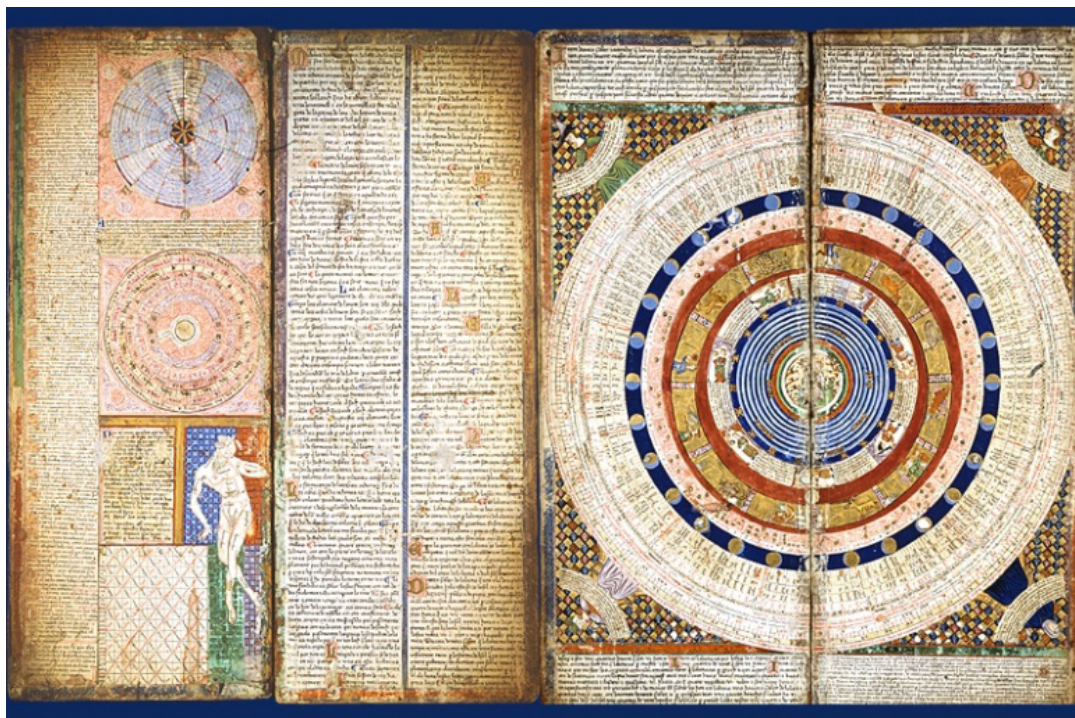
Figura 2 – Fólios Cosmográficos do Atlas Catalão (1375).