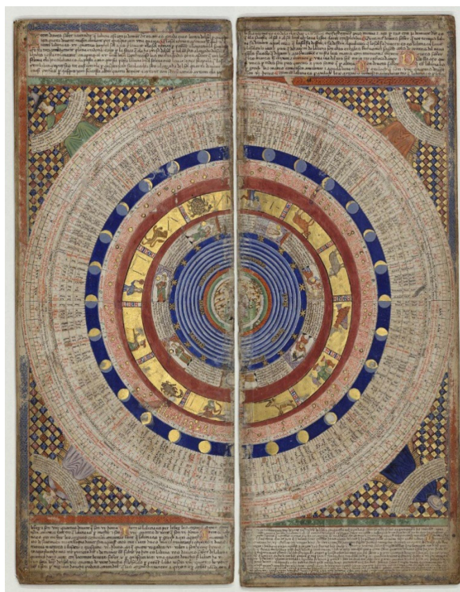
Figura 3 – Macrocosmo.