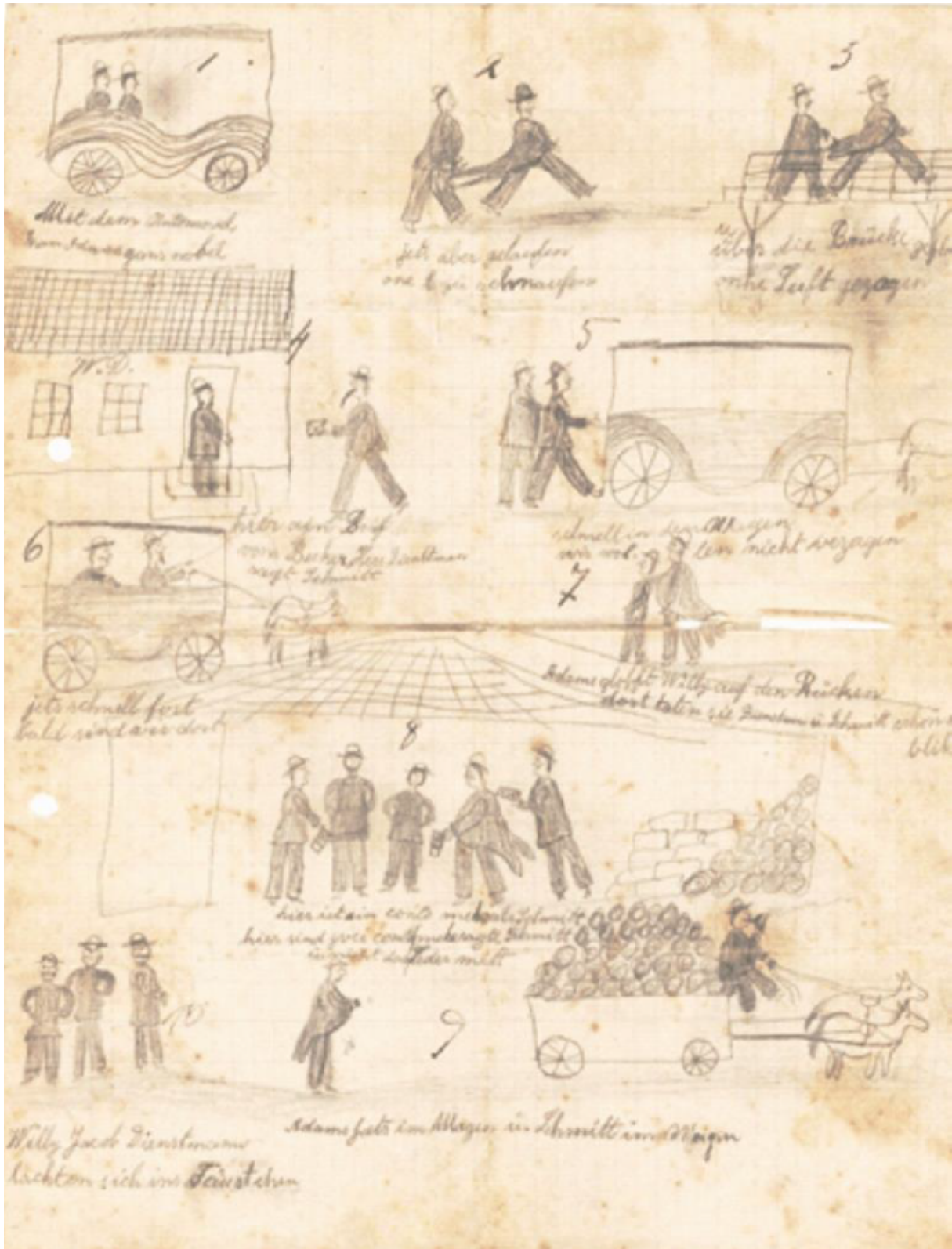
Figura 3 – História em quadrinhos.