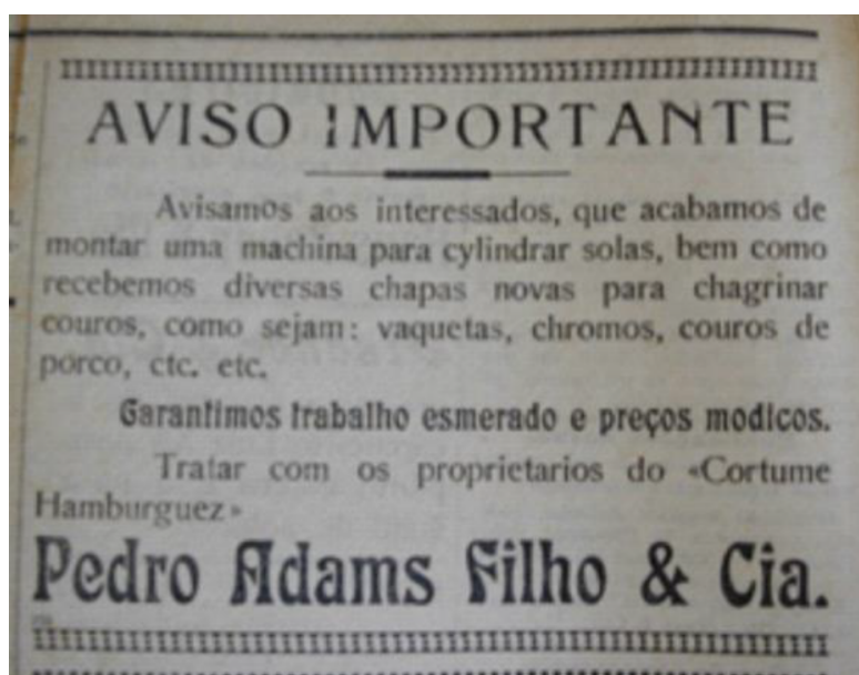
Figura 2 – Jornal O5 de Abril , 1935.