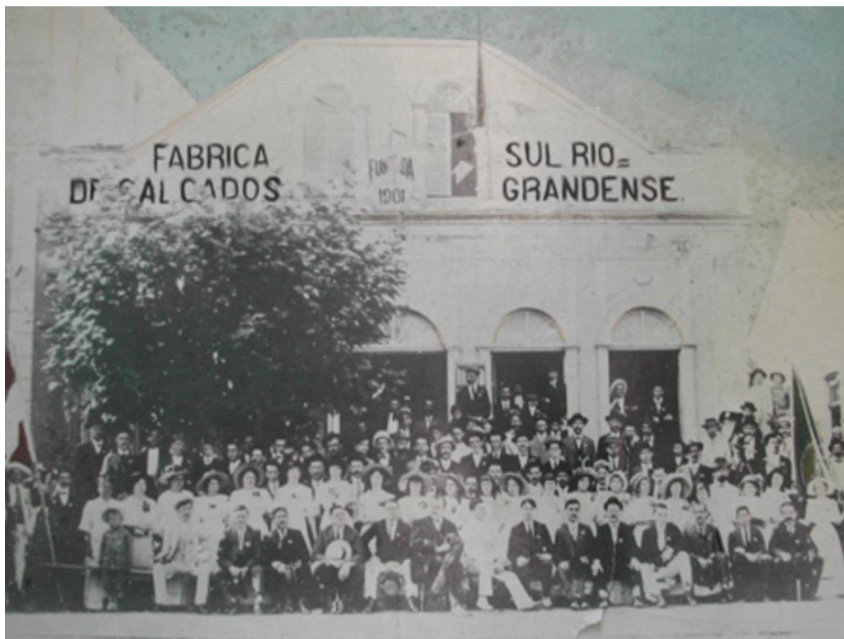
Figura 1 – Primeira foto tirada em frente a fábrica, em 1901.