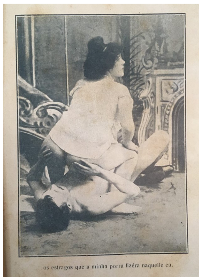
Figura 2: Reprodução fotográfica de Na Zona....

um tipo bonito de mestiça nacional; os seios pequenos e bastante rijos, não pareciam ser de puta; tinha as coxas grossas e com as pernas bem torneadas; a boca de lábios carnudos e sensuais, era naturalmente vermelha e pequena; o ventre arredondado encimava a pentelheira basta e negra donde emergia o cono papudo e certamente quente. Quanto à bunda, só posso dizer que era um cuzão de três assobios. (FELÍCIO, 1914, p. 8).