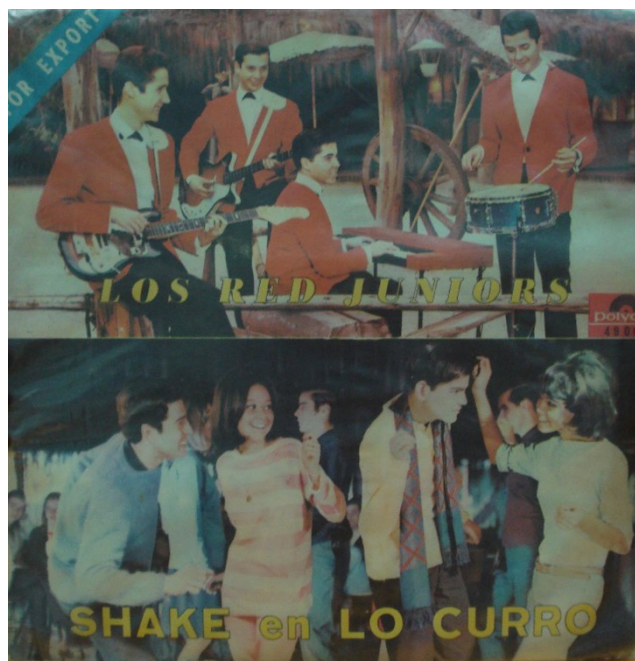
Figura 7 - Disco da banda Los Red .

E o disco “Shake en lo curro” 6 (Figura 7) de Los Red Juniors também segue a mesma linha: capa com duas fotografias coloridas da banda com a indicação For Export escrita no canto superior esquerdo e impressão de um texto com elogios à banda na contracapa. Gravado pela Polydor em 1966, com a utilização de bateria, guitarra, contrabaixo elétrico e piano.