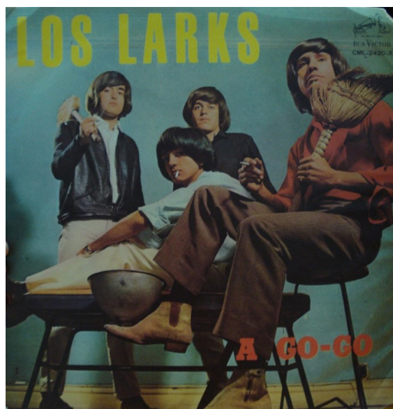
Figura 5 - Disco da banda Los Larks .