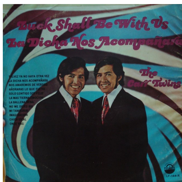
Figura 8 - Disco da banda The Carrs Twins .

Nesse sentido, apresento o disco “ Luck shall be with us ” 7 da banda The Carrs Twins , lançado pela gravadora Fermata. O texto da contracapa do disco foi impresso em espanhol e em inglês, há a utilização de outros instrumentos como teclados, diversos instrumentos de percussão, utilização de efeitos de estúdio nas vozes e distorções nas guitarras.