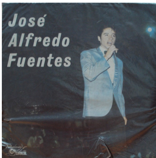
Figura 4 - Capa do disco José Alfredo Fuentes.