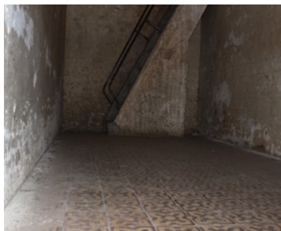
Figura 4. Porão do Quartel da Polícia Militar do Piauí, usado para torturar presos políticos durante ditadura militar. Foto de 31 de março de 2014.