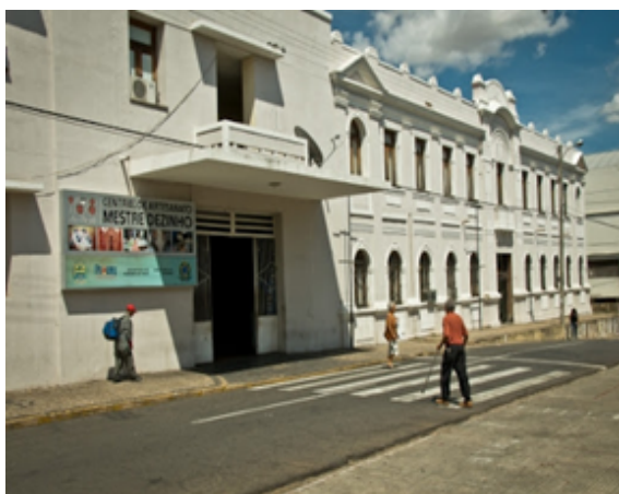
Figura 1. Fachada da Central de Artesanato Mestre Dezinho, no centro de Teresina-PI, em 13 de julho de 2012.

A Central de Artesanato “Mestre Dezinho” está localizada em frente à Praça Pedro II, no lado oposto ao Theatro 4 de Setembro, integrando, assim, o complexo cultural do centro da cidade de Teresina. O prédio abrigou a sede da Polícia Militar do Piauí até o ano de 1978, sendo depois transformado em centro artesanal, com a presença de mais de 20 lojas de produtos artesanais confeccionados a base de talos de buriti, fibras, couro e madeira. As lojas ainda oferecem camisetas personalizadas, guardanapos bordados, doces, licores, vinhos de caju, cachaça e a tradicional cajufina, que constitui um dos símbolos do Piauí (ver Figuras 1, 2 e 3).