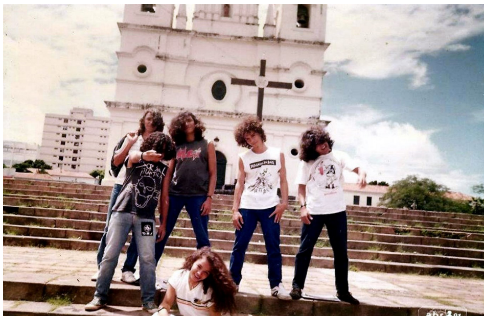
Figura 7. Headbangers (fãs de heavy metal) na escadaria da Igreja São Benedito em Teresina, em abril de 1991.