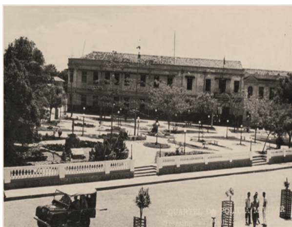
Figura 3. Quartel da Polícia Militar do Piauí (onde posteriormente passou a funcionar a Central de Artesanato Mestre Dezinho), na década de 1940.