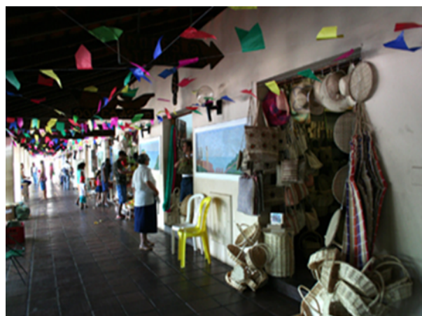
Figura 2. Lojas da Central de Artesanato Mestre Dezinho, em 12 de junho de 2008 (Foto: André Leão).