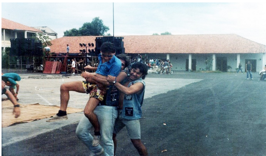
Figura 6. Montagem do palco do Festival Setembro Rock, pela manhã, na Central de Artesanato “Mestre Dezinho” em 1987.