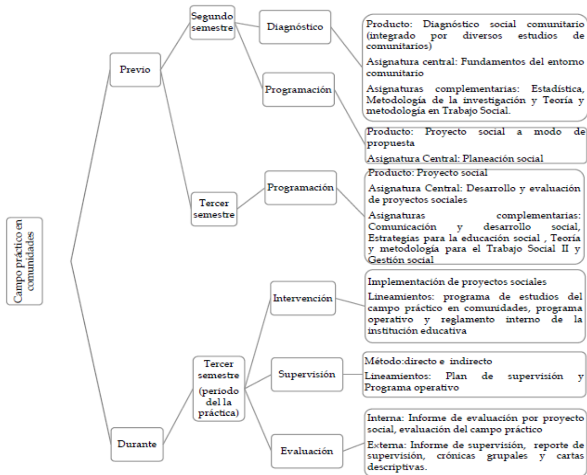
Figura 1. Proceso metodológico del Campo Práctico en Comunidades.