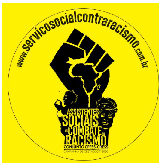
Figura 3. Material de la campaña Assistentes sociais no combate ao racismo .