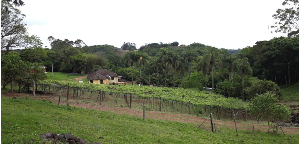
Foto 1 - Ruralidades de Silveira Martins/RS. 2019