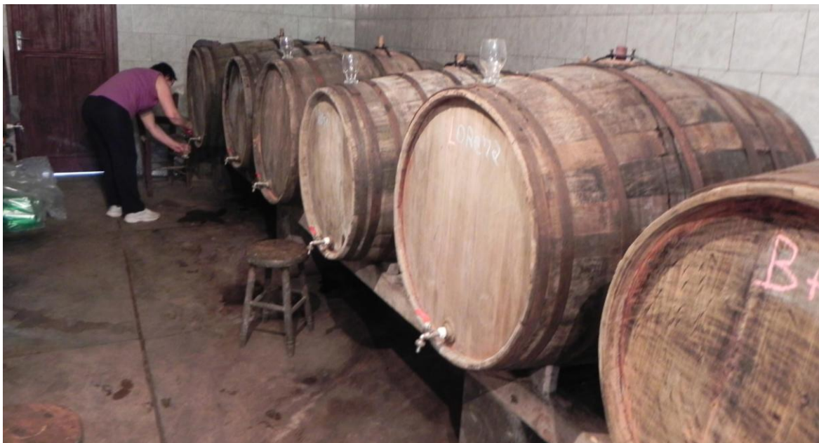
Foto 2 - Pipas de vinho em Val Feltrina, Silveira Martins/RS.