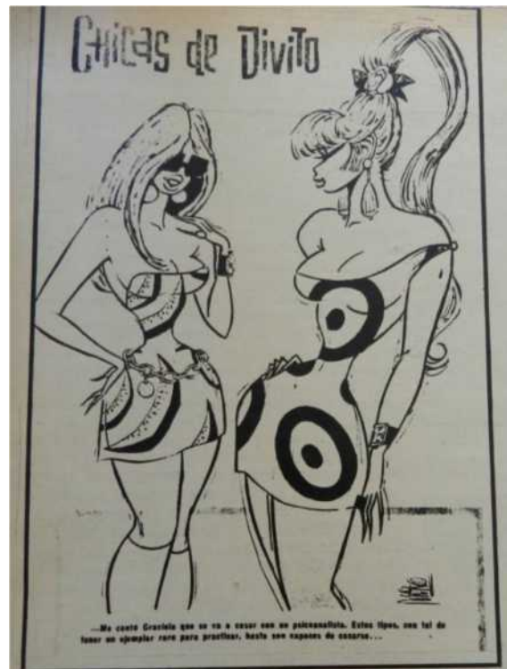
“Chicas Divito” Gente, 1969

Pero a diferencia de aquellas playmates de cuerpos voluptuosos, las revistas femeninas argentinas en los '60 mostraban imágenes corporales de un erotismo moderado. Las poses sugestivas incluían posiciones corporales femeninas descontracturadas, aunque muchas veces con un dejo de inocencia en ellas.