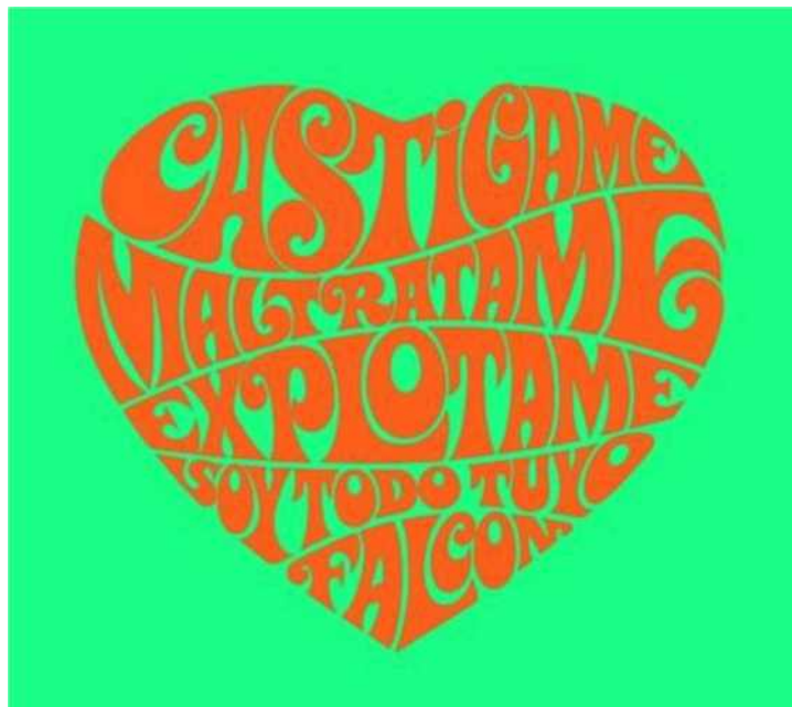
Publicidad Falcon, 1969

Para la época, la tensión entre el peligro y el placer sexual era muy poderosa. El erotismo se desataba en los vaivenes entre el constreñimiento, la represión y el peligro, y a la vez, la exploración y el goce.