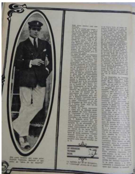
“Rodolfo Valentino” Femirama, Tomo 8, 05/1966

También los íconos eróticos masculinos se hallaban revestidos por el halo de la fatalidad. Entre los galanes legendarios se ubicaba Rodolfo Valentino, uno de los actores más famosos de la historia del cine de los años ’20, cuya azarosa y apasionante existencia lo había convertido en un „mito’. Muerto a los 21 años de edad, en 1926, se convirtió en un ícono de la seducción masculina. Se decía, además, que ante la noticia de su muerte algunas admiradoras se habían suicidado (“Rodolfo Valentino”, Femirama, Tomo 8, 05/1966, p. 142).