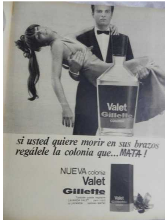
“Si usted quiere morir en sus brazos” Publicidad Colonia Valet Gillette, Femirama, Especial Navidad, 12/1967, p.185

El goce erótico puede ser destructivo y las pasiones, fervorosas, pero a la vez fulminantes. Esta dimensión fulminante de la pasión que entrelaza lujuria, placer y defunción ha estado simbolizada muchas veces con la figuración de la mujer desnuda y desvanecida (ver Figura 7). La imagen de la cautiva que se desmaya para sobrellevar el oprobio actualiza la tradición del rapto, el sexo y la violencia.