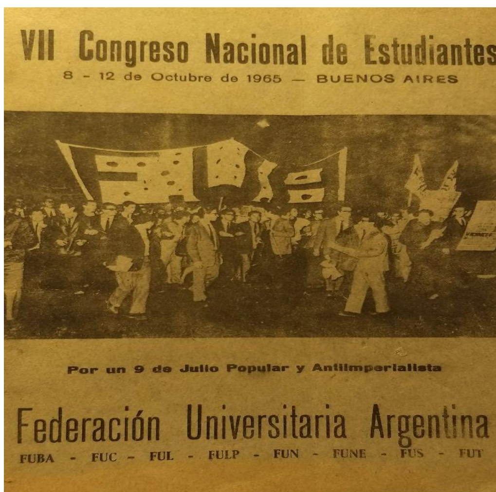
Figura 2. Congreso Nacional de Estudiantes de la FUA en 1965.