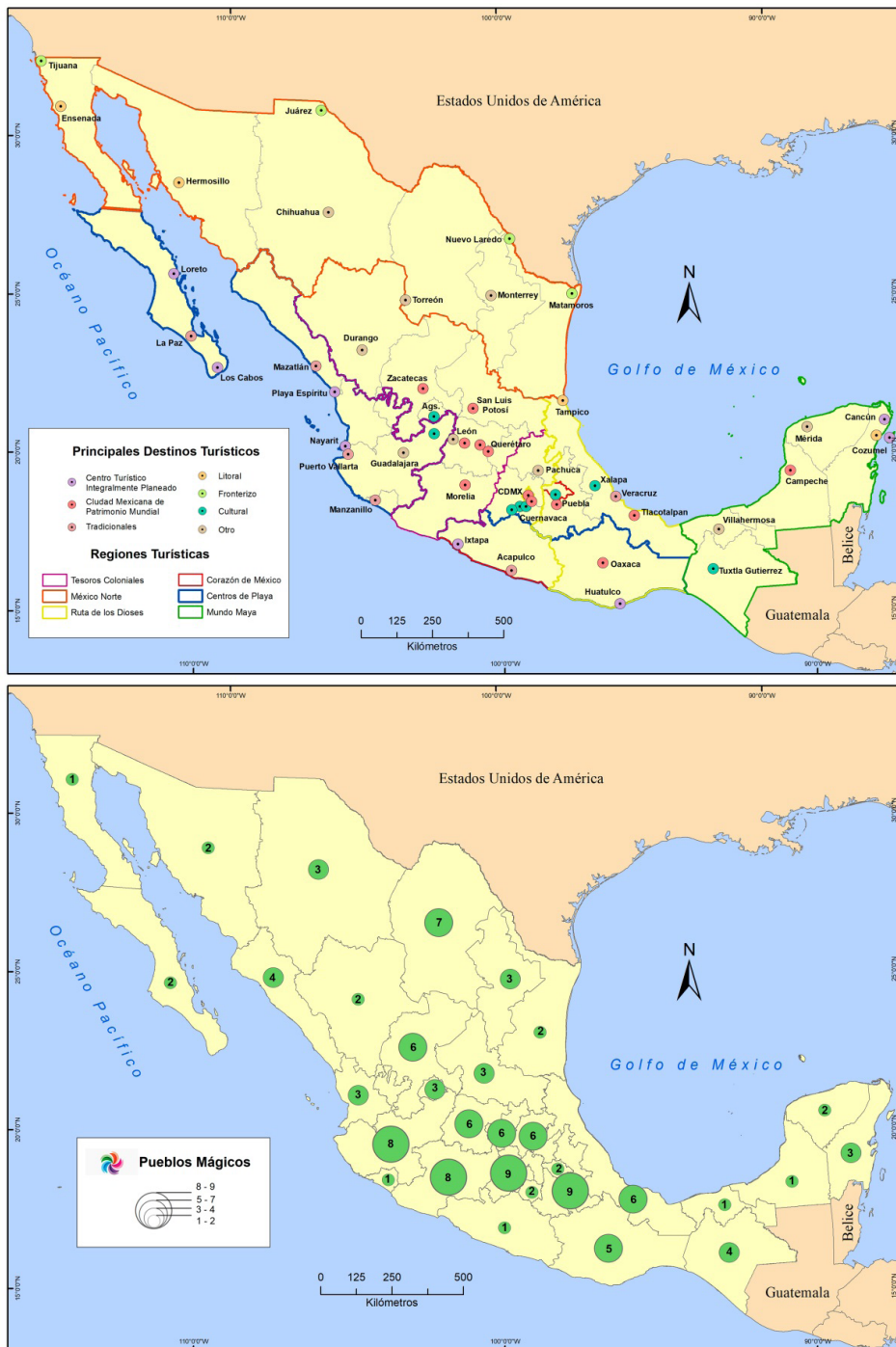
Figura 3. Principal oferta turística de México