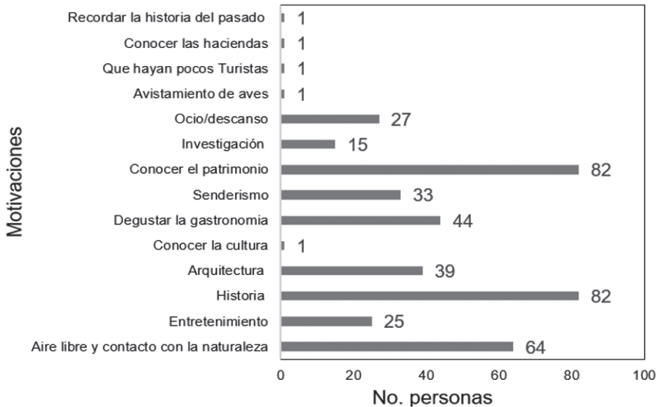
Figura 2. Motivaciones de turistas para realizar la ruta de las Haciendas Coloniales y Republicanas

A continuación, se detallan los hallazgos del trabajo de campo efectuado con los turistas interesados en la Ruta Patrimonial y con los propietarios de las haciendas, con el objetivo de identificar desde sus subjetividades elementos que aporten a la propuesta metodológica para el diseño de las experiencias turísticas de la Ruta de las Haciendas.