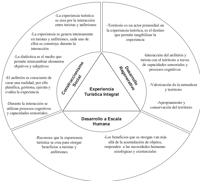
Figura 4. Tríada para la creación de las experiencias turísticas integrales