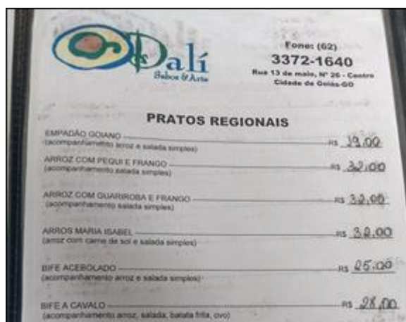
Figura 6 Cardápio do Restaurante Dali: Yakissoba, Panqueca ou Empadão goiano? Trabalho de campo.