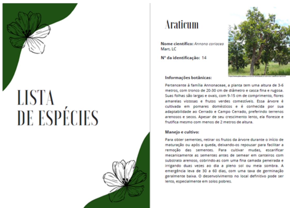
Figura 2: Páginas do Guia de campo das espécies presentes na área

A área de estudo revelou que, apesar da interferência humana e do significativo avanço da urbanização em seu entorno, a flora local ainda apresenta uma elevada riqueza de espécies nativas. Essa diversidade destaca a necessidade de conservação, manutenção e reconhecimento por meio de políticas públicas e da conscientização da sociedade, esforços que podem ser potencialmente fortalecidos pelo guia de campo elaborado.