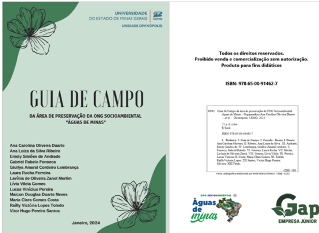
Figura 2: Páginas do Guia de campo das espécies presentes na área